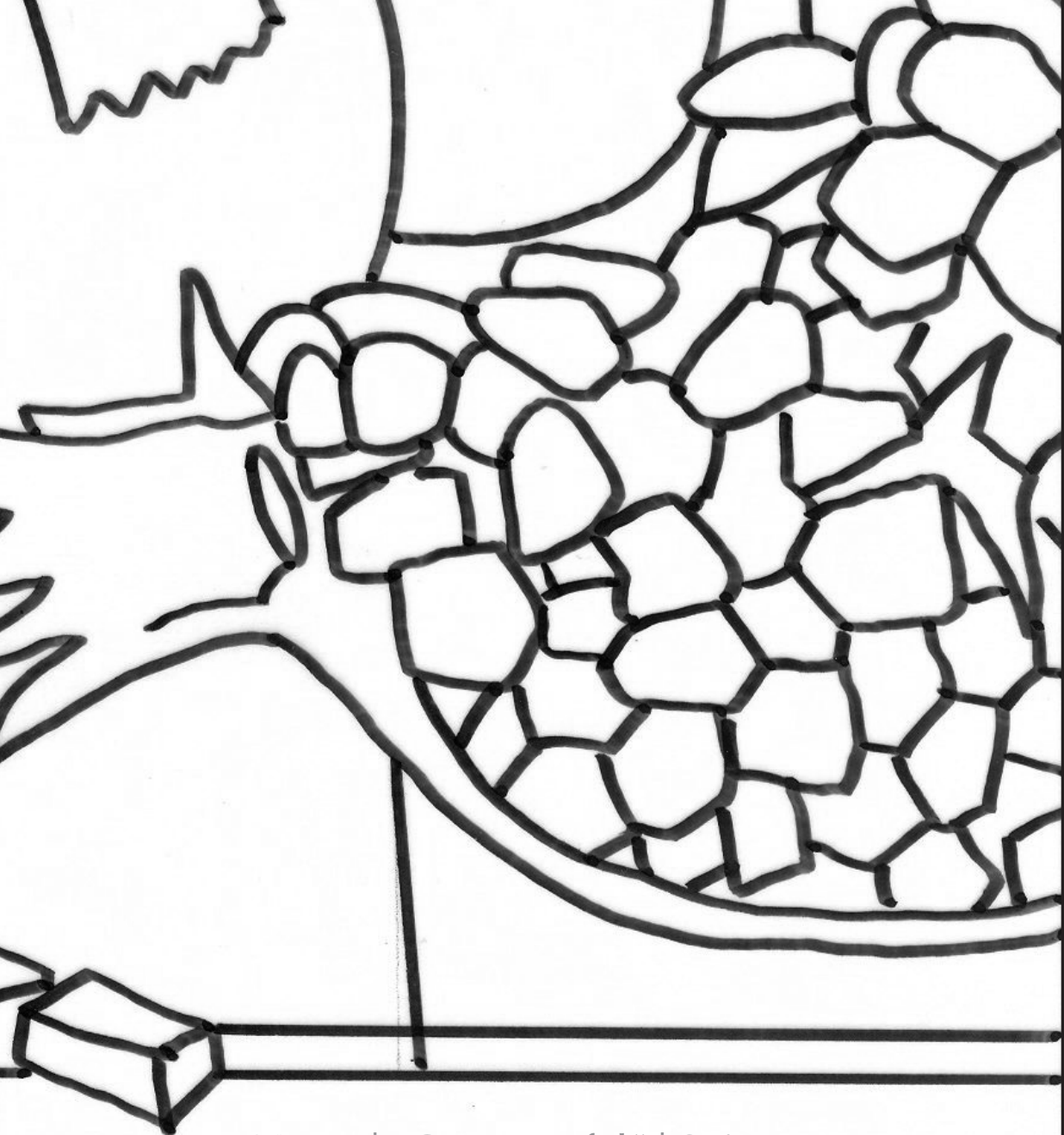
Nr. 65 | „Granatapfel“ | Seite 38 Reihe 2 Blatt 4 von 4