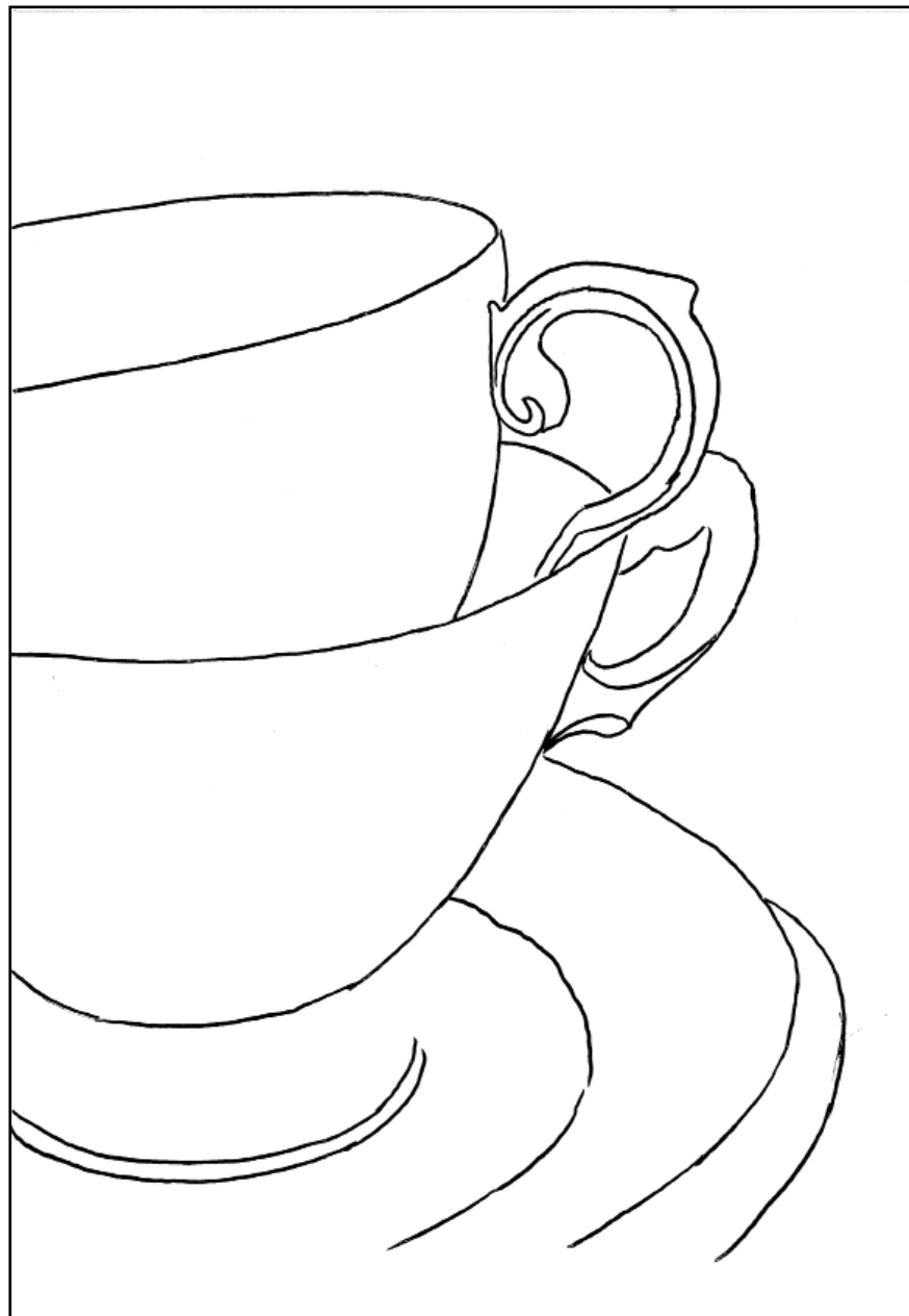
Nr. 85 | „Lieblingstassen“ | Seite 78 Übersicht