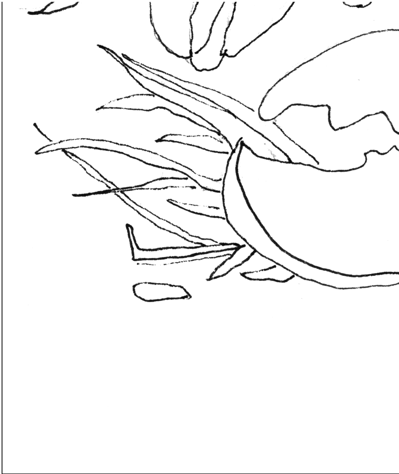
Nr. 52 | „Aus der Atelier-Küche: Hummer frangfrisch“ | Seite 24 Reihe 2 Blatt 4 von 6