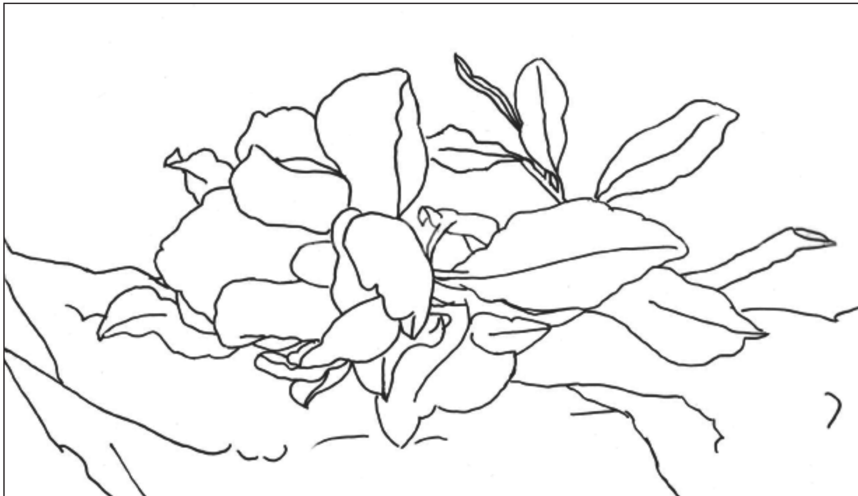
Nr. 59 | „Magnolia“ | Seite 70-73 Übersicht