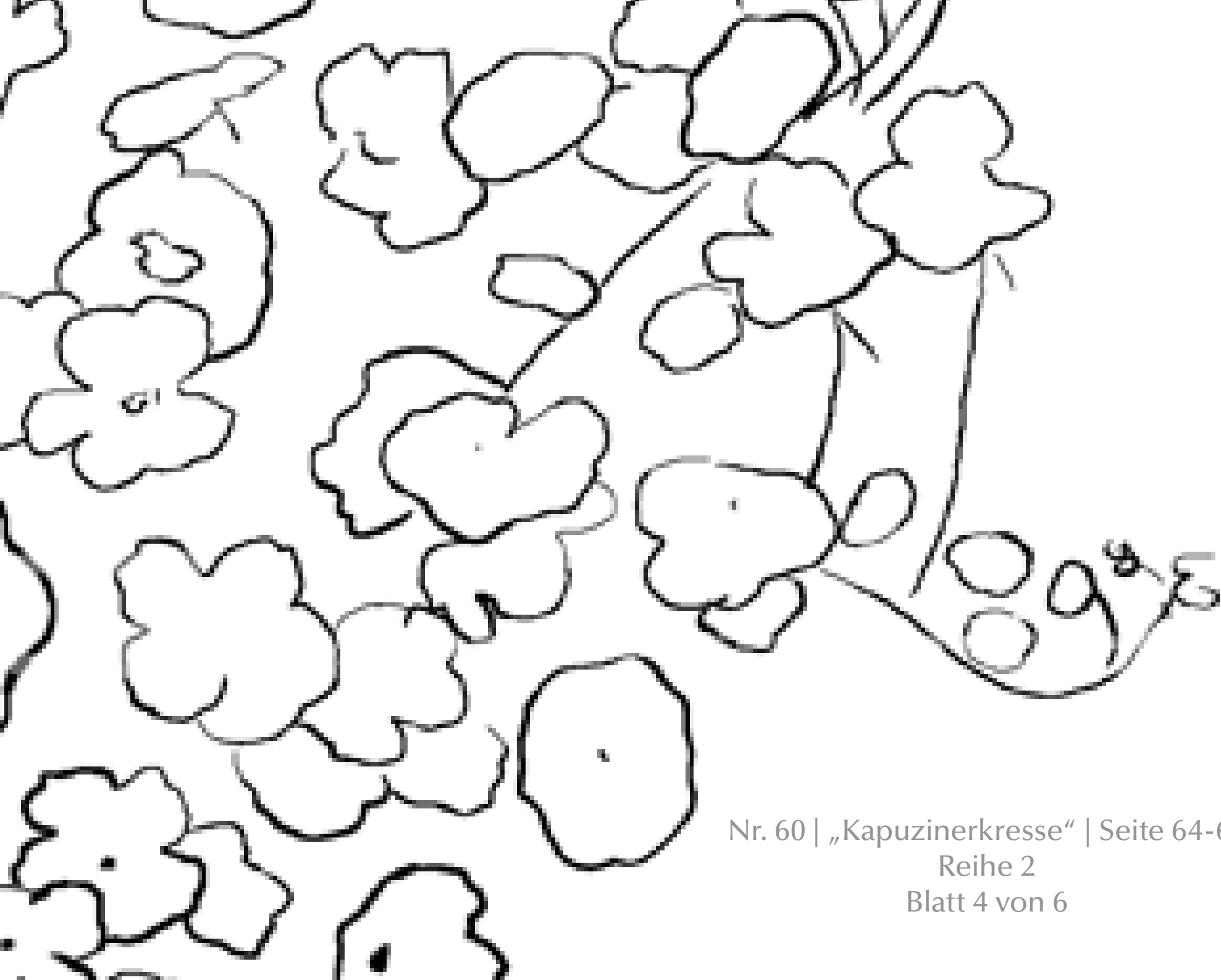
Nr. 60 | „Kapuzinerkresse“ | Seite 64-67 Reihe 2 Blatt 4 von 6