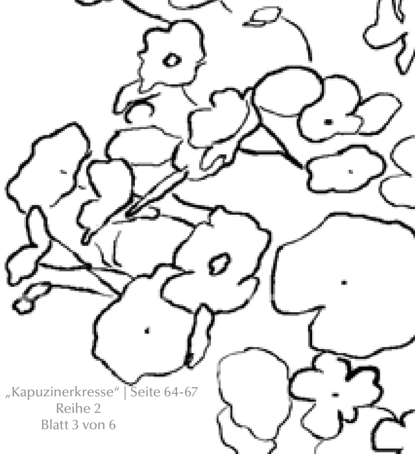
Nr. 60 | „Kapuzinerkresse“ | Seite 64-67 Reihe 2 Blatt 3 von 6