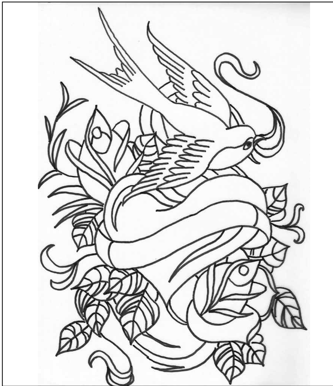
Nr. 88 | „Tattoo-Style“ | Seite 58 Übersicht