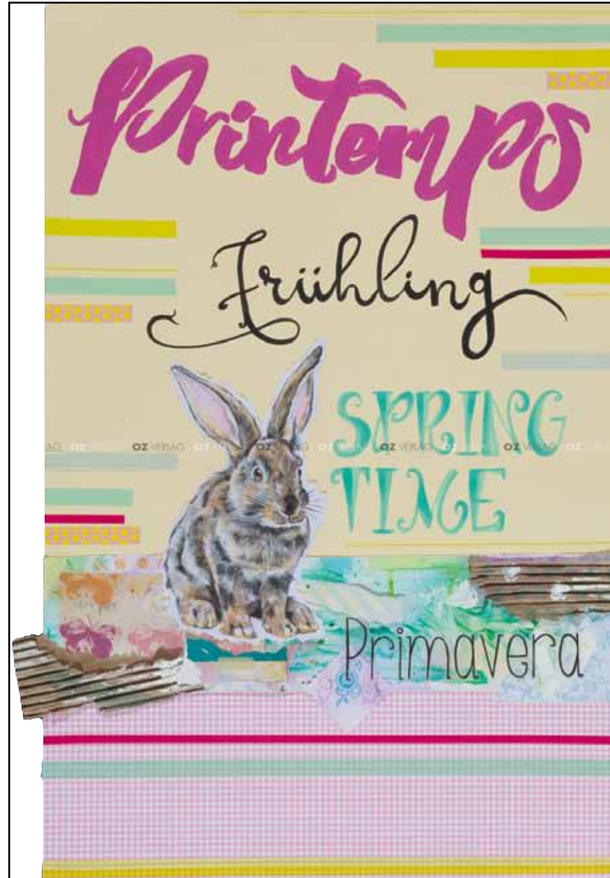
Nr. 89 | „Endlich Frühling“ | Seite 10 Übersicht